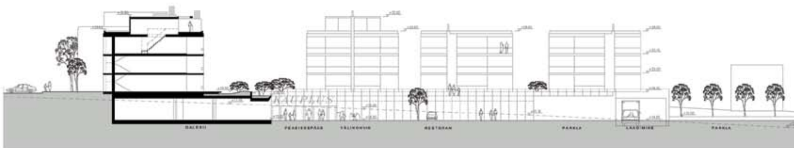
LÕIGE A - A